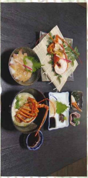
※写真は過去のえつがね祭り定食です