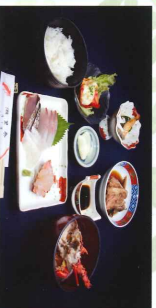
※写真は過去のえつがね定食です