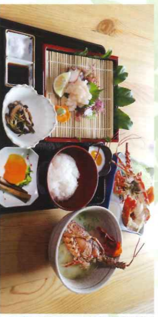
※写真は過去のえつがね定食です