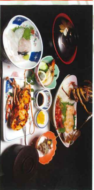
※写真は過去のえつがね定食です