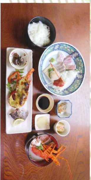
※写真は過去のえつがね定食です