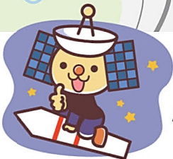
肝付町のゆるキャラ いて丸くん