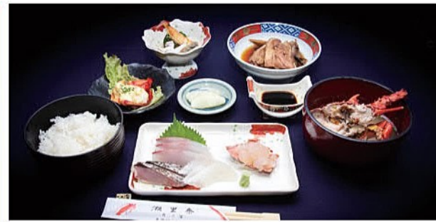
※写真は過去のえっがね定食です

※11:00～13:30ラストオーダー ご予約優先 ◎18:00～21:00(20:30ラストオーダー) ご予約のみ ◎肝付町北方550-1 ☎0994-67-3387