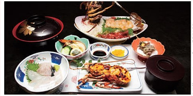
※写真は過去のえっがね定食です

※11:30～13:00ラストオーダー ご予約のみ ☎なし ◎肝付町南方280 ☎0994-67-2704