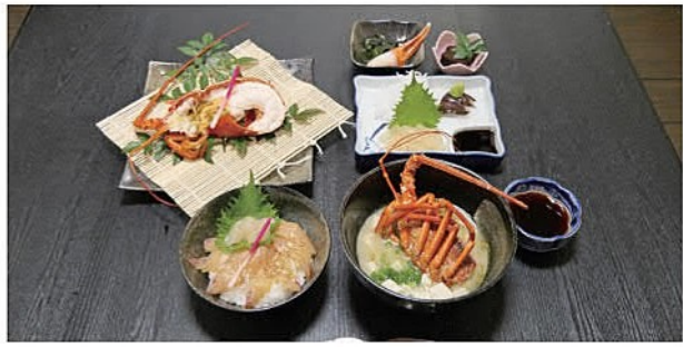
※写真は過去のえっがね彩り定食です