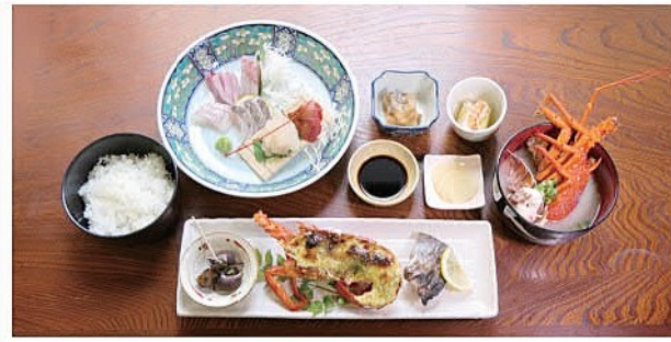
※写真は過去のえっがね定食です

※11:30～14:00(13:45ラストオーダー) ご予約のみ ☎なし ◎肝付町新富387-1 ☎0994-65-2835