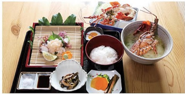
※写真は過去のえっがね定食です

※11:00～14:00(13:30ラストオーダー) ご予約優先 ◎18:00～20:00 ご予約のみ ◎肝付町南方298-4 ☎0994-67-2623